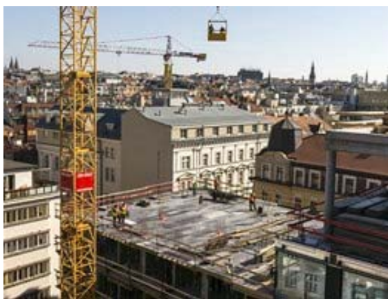
Obytná budova s luxusními byty čeká ještě na jedno podlaží.

Právě více než dostatečná veřejná doprava, kterou budou mít nájemci i návštěvníci Quadria k dispozici, je také důvodem, proč zde sice vzniklo 250 parkovacích míst v podzemí, kam se bude sjíždět z Vladislavovy ulice, ale využít je budou moci jen rezidenti.