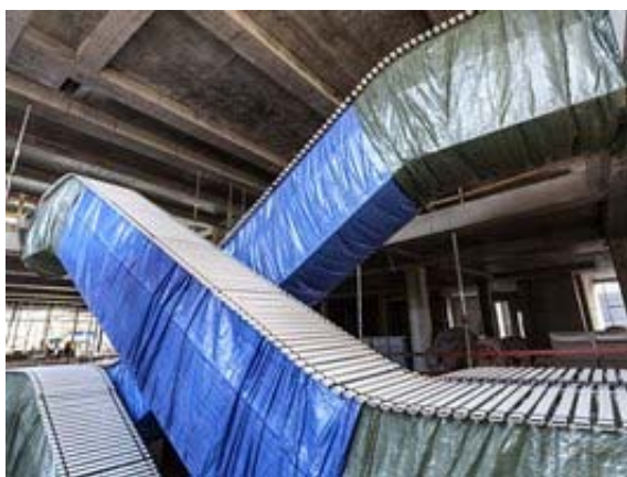
Eskalátory jsou již na místě.