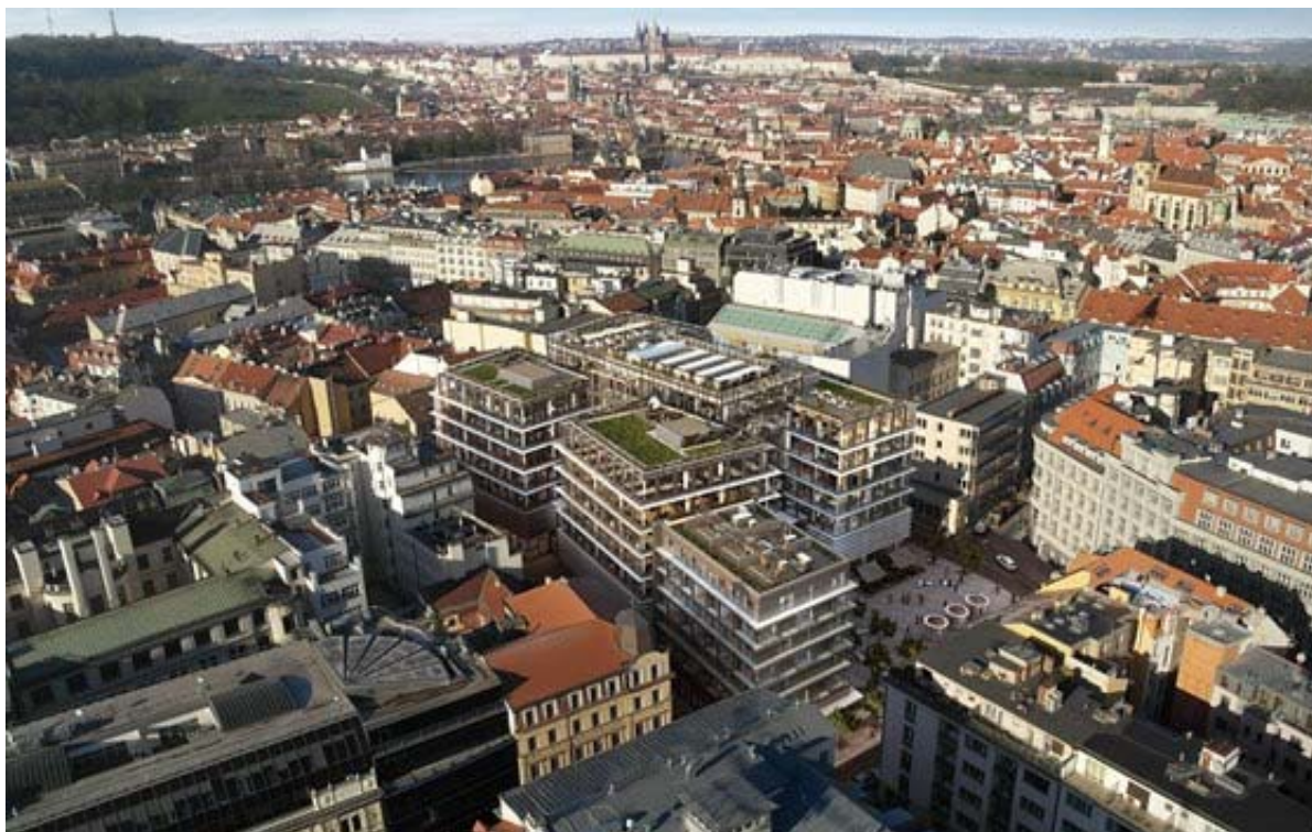
Vizualizace: Pohled na Quadrio v centru Prahy

Centrum Prahy získá po dostavbě zajímavý multifunkční komplex, a to i pokud jde o vzhled. Hlavní vnitřní objekt zdobí 3D prostorová skleněná fasáda, vnější kancelářské budovy obepínají ve spodní části pevné lamely, které zčásti kryjí i prosklené stěny obchodních jednotek nákupní galerie.