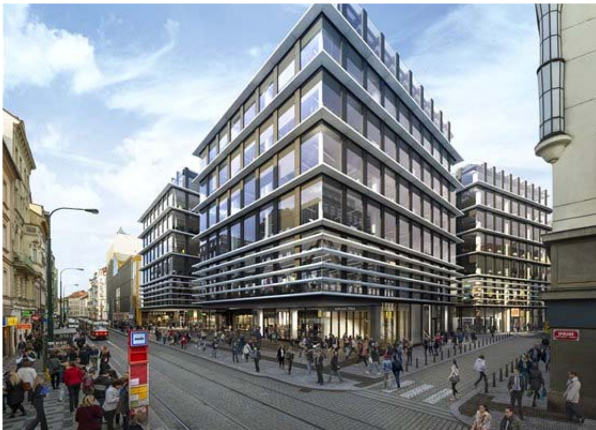
Vizualizace: Pohled ze Spálené ulice

Pokud jde o klientské změny v těchto bytech, jejich realizaci ovlivňuje potřebná orientace s ohledem na oslunění. "Změny vidím spíše ve výběru materiálů než v zásahu do dispozic," říká architekt Cígler. Metr čtvereční zde zájemce o bydlení přijde až na 150 tisíc korun.