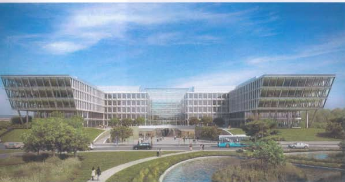
COM CITY Moskva, Ruská federace, odhadovaný termín realizace fáze A: leden 2014